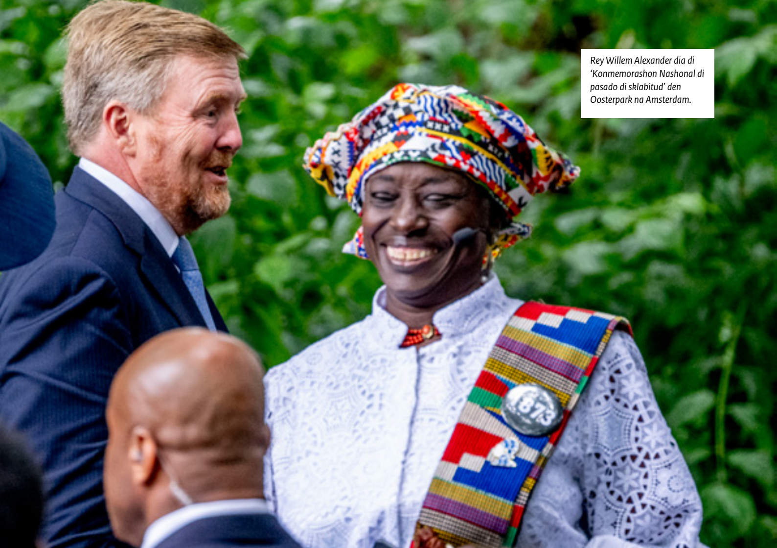
Rey Willem Alexander dia di "Konmemorashon Nashonal di pasado di sklabitud" den Oosterpark na Amsterdam.