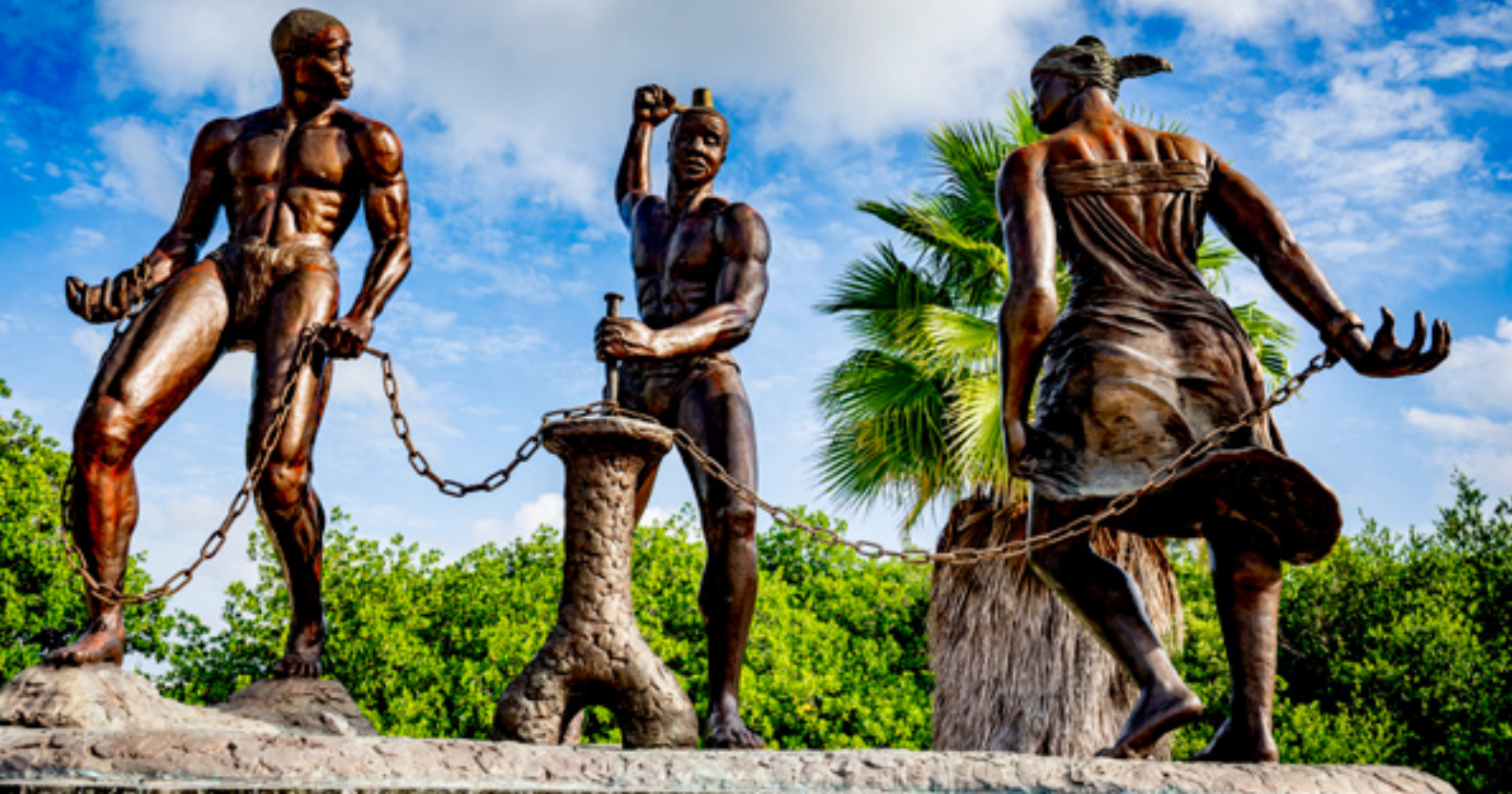
Monumentu 'Deskadená' den Parke Lucha pa Libertad na Korsow